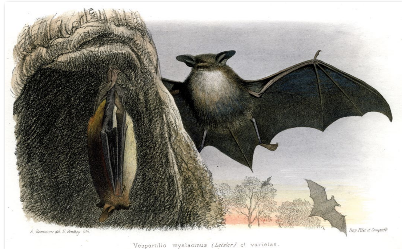
Vespertilio mystacinus (Leisler) et varietas.

Kaum ist die Sonne gesunken, so schwirrt pfeilschnell die dunkle Gestalt der Fledermaus über dem Haupte des Wanderers. Ihr kleiner, weicher Körper hat das samtne Fell der Maus. Auch die Hinterfüße beider Tiere zeigen viel Ähnlichkeit; aber die Vorderfüße sind ganz verschieden gebaut. Die Maus hat kurze Füße mit Krallen zum Graben; die Vorderbeine der Fledermaus hingegen sind zu Flugwerkzeugen umgestaltet. Zwischen ihren Zehen ist eine graue, zarte Haut ausgespannt, ähnlich wie das Tuch zwischen den Stäben eines Regenschirmes. Diese reicht bis zu den Hinterfüßen. Sie kann ausgebreitet und zusammengeklappt werden. Mit Hilfe der Haut flattert die Fledermaus vortrefflich. Bald segelt sie in bedeutender Höhe und erschnappt dort Fliegen; gleich darauf schießt sie herunter auf das Wasser und erhascht Mücken und Käfer. Beim Insektenfange wird sie weniger durch das Auge als durch die ausserordentliche Feinheit ihres Gefühls in der Flughaut, sowie durch ihren ausgebildeten Geruchssinn und ihr feines Gehör unterstützt. Wir erkennen die kleinen Tierchen, von denen die Fledermaus lebt, selbst bei hellem